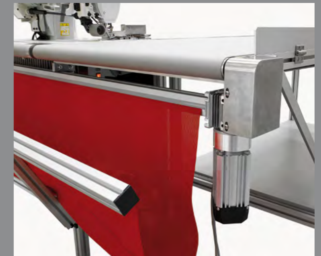
Fabric box in front of the machine / Bolsa de recogida en la parte delantera de la máquina