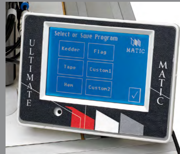
Quick Change Mode / Modo QCM