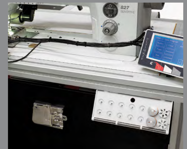
Storage for bobbins and guides / Almacén para canillas y guías