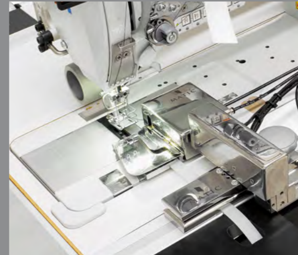
Automatic tape cutting and feeding system / Sistema automático de alimentación y corte de la cinta