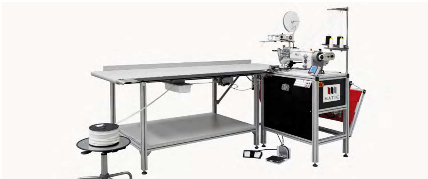
Standing Workstation, is the most ergonomic machine, with non-skilled operators in a small working area / Puesto de trabajo ergonómico, adaptado para trabajar de pie, sin necesidad de operario especializado y con un espacio de trabajo reducido

Una gran solución en un pequeño espacio. Su dimensión, de sólo 4m2, permite ubicarla en cualquier taller.