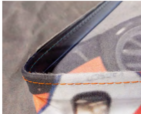
Flat profile / Perfil plano

AUTOMATIC SEWING MACHINE / MÁQUINA DE COSTURA AUTOMÁTICA