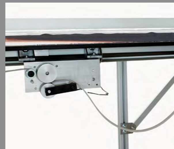
Tension free for flat profile / Prealimentador sin tensión del perfil plano