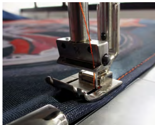
Double Hem / Doblado doble

Conveyor lock enables to production of curved seams for teardrop flags, etc. A big solution in a small package. CRONOS utilizes only 4m2 (43ft2) of work space, allowing it to fit in any size workroom.